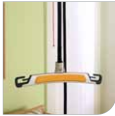
2-pisteen nostokaari, leveys 45 cm