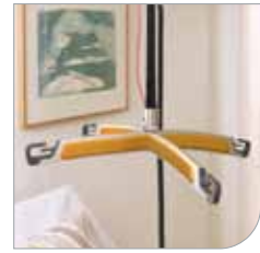
4-pisteen nostokaari, 50 x 40 cm

HUOM! 4-pisteen nostokaarta ei käytetä matalan nostoliinan kanssa.