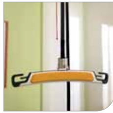
2-pisteen nostokaari, leveys 50 cm